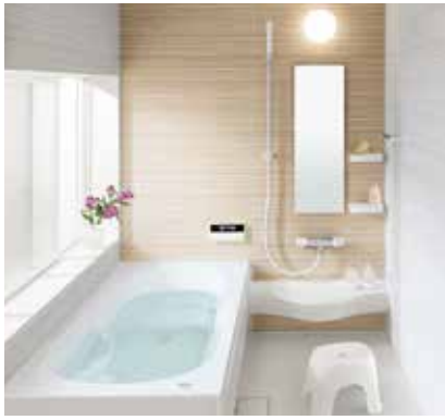
ナストラック 定価:781,100円(税別)