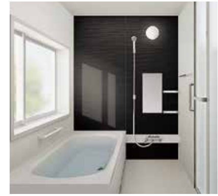
ハウステック 定価:684,000円(税別)