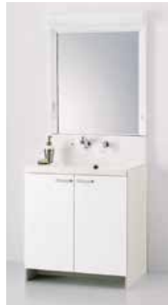
ナストラック 定価:181,500円(税別)