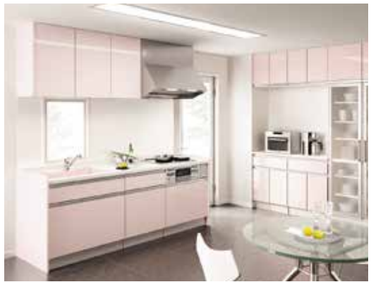
ナストラック 定価:698,500円(税別)