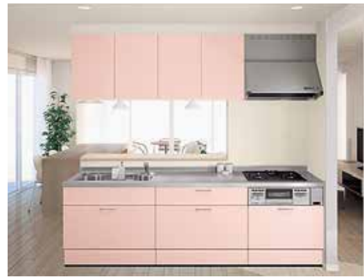
ハウステック 定価:588,400円(税別)