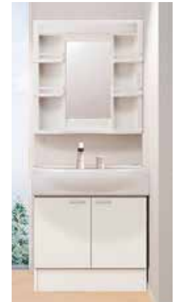
ハウステック 定価:103,400円(税別)