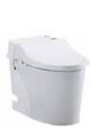
ジャニス工業製 定価:221,400円(税別)